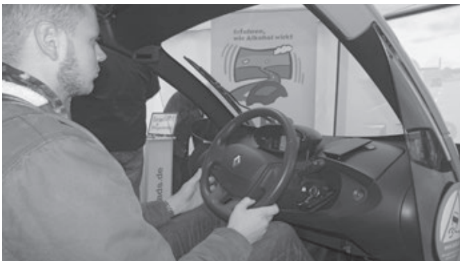
Schüler der Hein-Möller-Schule im Fahr Simulator