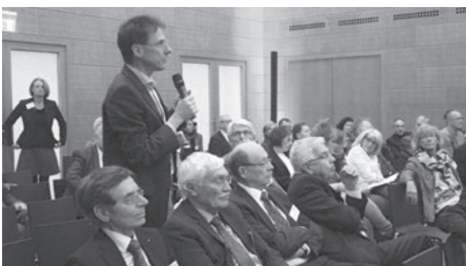
Auditorium während der Diskussion