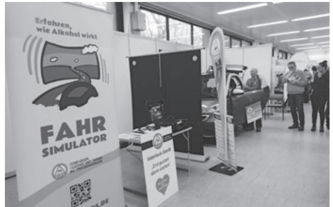
Gesundheitsmesse in Neumünster 2019

Verkehrsteilnehmer verletzt oder getötet. 75 (-23,5 %) Unfallbeteiligte verunglückten leicht und 35 (+9,4 %) schwer. Besonders bedrückend ist die Tatsache, dass bei drei dieser Verkehrsunfälle fünf Unfallbeteiligte getötet wurden. Es handelte sich um Mitfahrer in Pkws, bei denen der Fahrer unter dem Einfluss von Drogen stand. Alle drei Fahrer waren im Alter zwischen 18 und 25 Jahren, auch drei der verstorbenen Mitfahrer gehörten dieser Altersgruppe an.