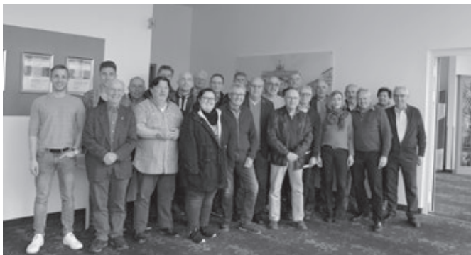
Die Teilnehmer der Instrukturstagung in Fulda

Die Veranstaltung war wieder ein voller Erfolg. Die regen Diskussionen, Ideen und Anmerkungen waren ebenso wie der Erfahrungsaustausch für alle Teilnehmer ein großer