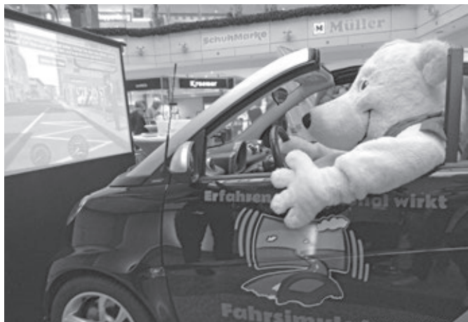
Auch dieser Eisbär findet den Smart-Realo-Fahrsimulator cool

Zum ersten Mal überhaupt verlieh der BADS die Senator-Lothar-Danner-Medaille in Gold an einen Vertreter der Rechtspflege, der die Interessen von Bürgern in Straf- und