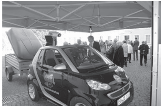
Fahrsimulator vor dem Saarbrücker Schloss