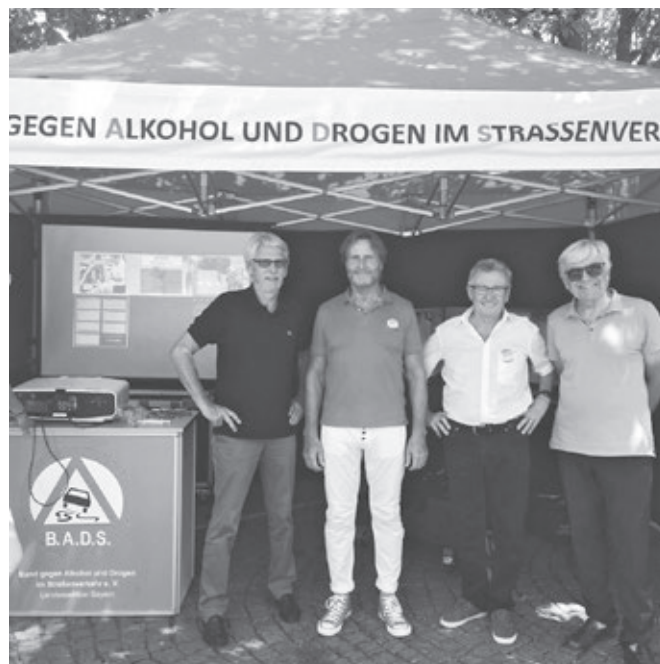
Die Landesektion mit dem Fahrsimulator auf dem Tag der Verkehrssicherheit in Ingolstadt

Bei einer weiteren Fortbildung im November 2018 für sämtliche Richter und Staatsanwälte referierte Dipl.-Ing. Jürgen Bönninger aus Dresden zum Thema „Automatisiertes und vernetztes Fahren kommt mit Sicherheit, aber“.