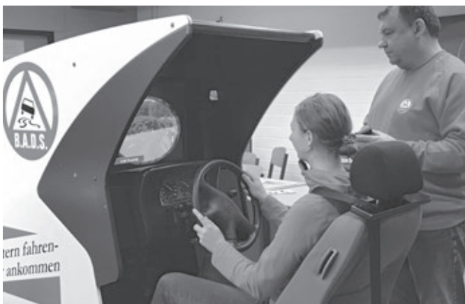
Der Fahr Simulator im Einsatz bei der Aktionswoche

An elf Aktionstagen wurde der Fahr Simulator z.B. an Berufsschulen sowie für Präventionsveranstaltungen und verkehrspädagogische Trainingskurse der Deutschen Vereinigung für Jugendgerichte und Jugendhilfe e.V. eingesetzt. Allein an diesen Kursen nahmen über 50 Jugendliche