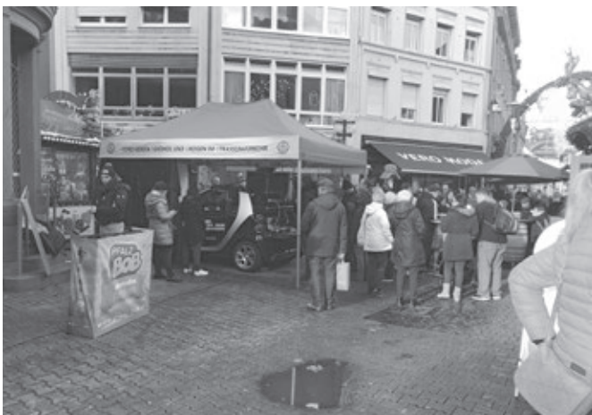
Einsatz des Fahrsimulators der Landessektion anlässlich der Aktionswoche 2018