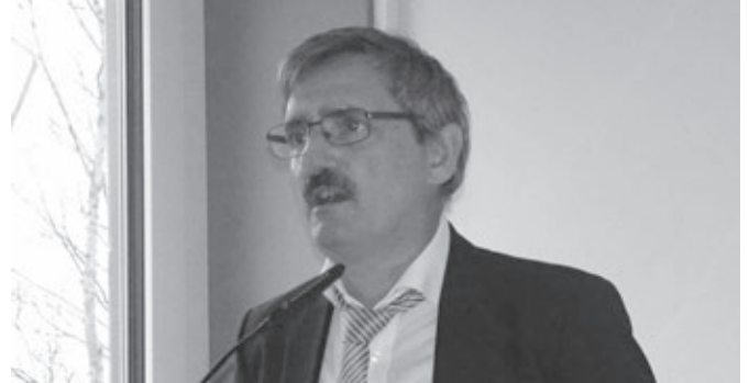
Guido Zielke, Abteilungsleiter Straßenverkehr, Bundesministerium für Verkehr und digitale Infrastruktur