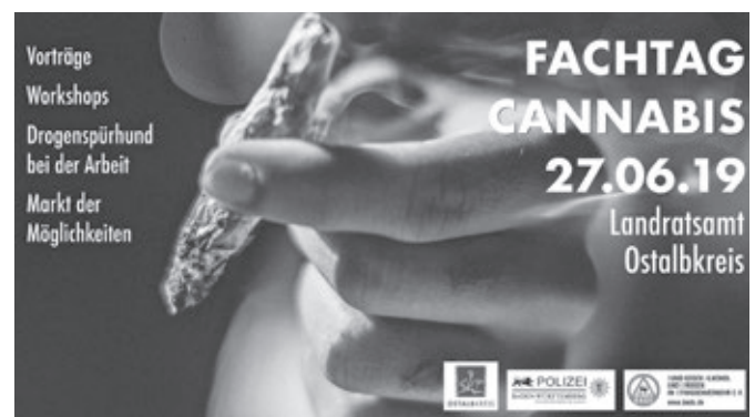
Ankündigung des Cannabis-Fachtages

Es zeigt sich, dass das Konzept aufgeht, junge Menschen mit modernen Medien anzusprechen. Information und Überzeugung können so auch Spaß bereiten. Das ist der neue Weg, Inhalte so zu vermitteln, dass sie verstanden und umgesetzt werden.