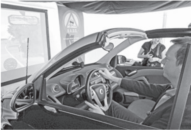
Voll konzentriert: Ministerpräsident Tobias Hans

durfte sie auch die höchsten politischen Repräsentanten des Landes, den Präsidenten des Saarländischen Landtages, Stephan Toscani, und den jungen Ministerpräsidenten des Saarlandes, Tobias Hans, als „Fahrgäste“ begrüßen. Beide zeigten sich von der simulierten Alkoholfahrt im Smart-Realo sehr beeindruckt.