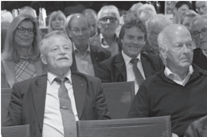
Teilnehmer der Mitgliederversammlung