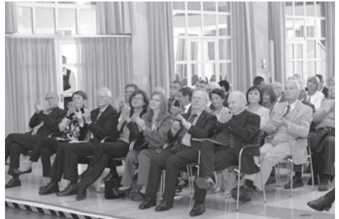
Gäste des Festakts