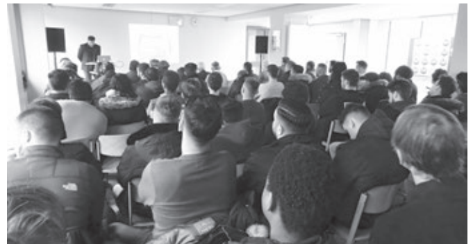
Schüler der Hein-Möller-Schule