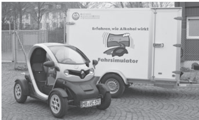
Der Renault Twizy mit neuem Transportanhänger

Fazit: Es wurden an zwei Tagen mit insgesamt sechs Kontrollstellen 1.814 Verkehrsteilnehmer überprüft. Insgesamt wurden 104 Blutentnahmen wegen des Führens von Kraftfahrzeugen unter illegalen Drogen- (99-mal) und Alkoholeinfluss (5-mal) angeordnet.