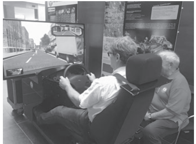
Einsatz des Fahrsimulators am 18.06.2019 beim Gesundheitstag im Bundesverkehrsministerium in Berlin

Die enge Zusammenarbeit mit der Polizei in Berlin und Brandenburg zeigte sich erneut in gemeinsamen Ständen bei Aktionen wie der Jugendmesse „You“ oder der Teilnahme der Landessektion am Tag der „Offenen Tür“ der Berliner Polizei mit ca. 30.000 Besuchern. Hier wie bei vielen anderen Veranstaltungen in Schulen, Diskotheken und bezirklichen Veranstaltungen kam der Fahrsimulator zum Einsatz, wo er immer, gerade für junge Menschen, ein besonderer Publikumsmagnet war.