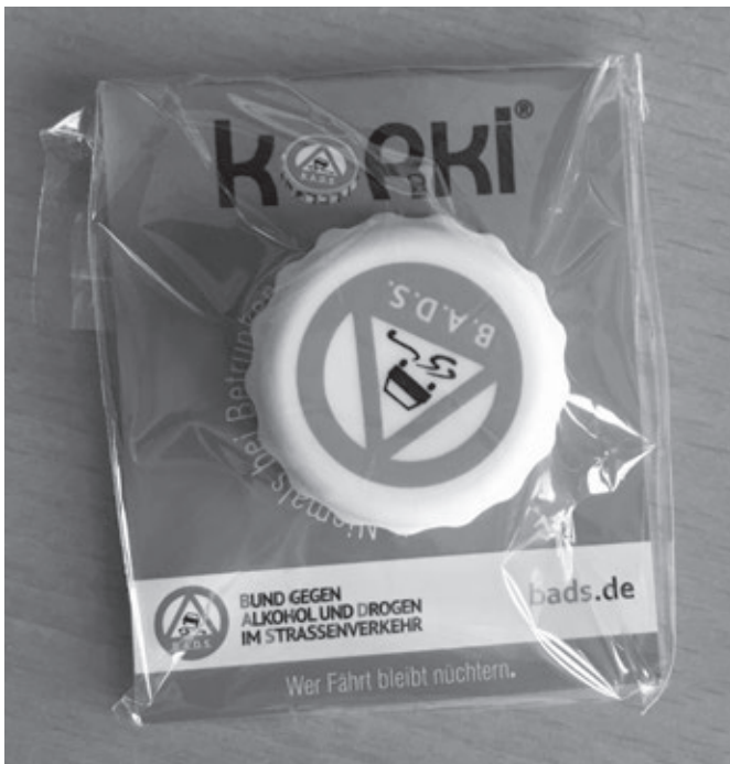
Der Silikon-Kronkorken „Korki“

to lautet „Informieren und überzeugen“. Dazu hat sich die mittlerweile als „Fahrertaler“ bekannte Münze „Einer bleibt nüchtern“ fest etabliert. Diese Münze wird äußerst gerne als Erinnerung aus Veranstaltungen und Vorträgen mitgenommen, sie wird von verschiedenen Peer-Projekten aus ganz Baden-Württemberg angefordert und erfreut sich auch großer Nachfrage beim Dt. Verkehrsgerichtstag in Goslar.