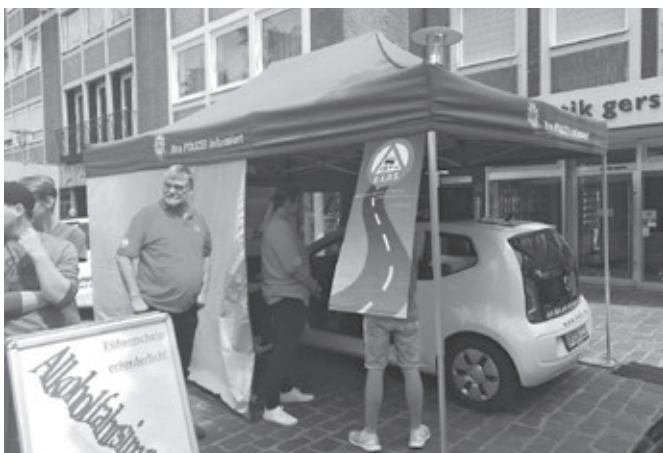
Der Fahrsimulator im Einsatz bei Kaarst Autal am 19.05.2019

Am 21.02.2019 veranstaltete die Landesektion einen Trinkversuch für interessierte Amtsanwälte und Staatsanwälte in Räumlichkeiten der Staatsanwaltschaft Düssel-