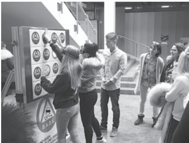
Die T-Wall, ein Publikumsmagnet

Der nur von der Landessektion betriebene Motorradfahr-Simulator war bei sehr vielen großen landesweiten Aktionstagen zum Thema Verkehrssicherheit gefragt. Aufbau und Betrieb dieses Simulatormodells sind sehr aufwändig und kostenintensiv, weshalb großes Engagement und hohe Einsatzbereitschaft Voraussetzung für dieses Präventionsmodul sind.