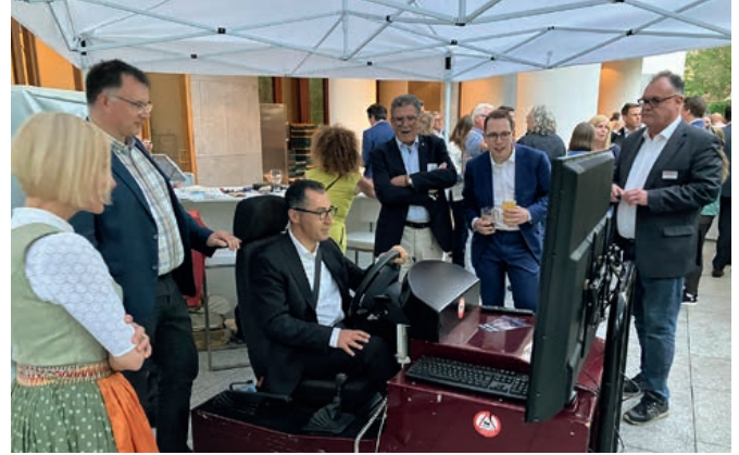
Bundeslandwirtschaftsminister Cem Özdemir im Fahrsimulator