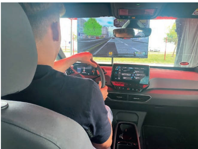
Der Fahrsimulator endlich wieder im Einsatz

Entnommen aus dem Fitnessbereich, sorgen die Geräte bei jedem einzelnen Einsatz für gute Laune und positive Präventionserfahrungen bei der Zielgruppe der jungen Leute. Die Blazepods sind bereits jetzt nicht mehr aus dem Angebot wegzudenken.