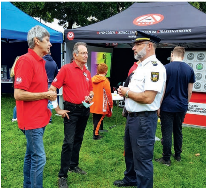
Landespolizeipräsident Norbert Rupp (re.) informiert sich am Stand des BADS

Als zukunftsichernde Maßnahme hat die Landesektion zwei noch aktive Polizeibeamte und einen frischen Ruhestandler, alle mit jahrelanger Expertise auf dem Gebiet der Verkehrsunfallprävention, als neue Instruktoren für den Einsatz des umfangreichen Simulator-Equipments ge-