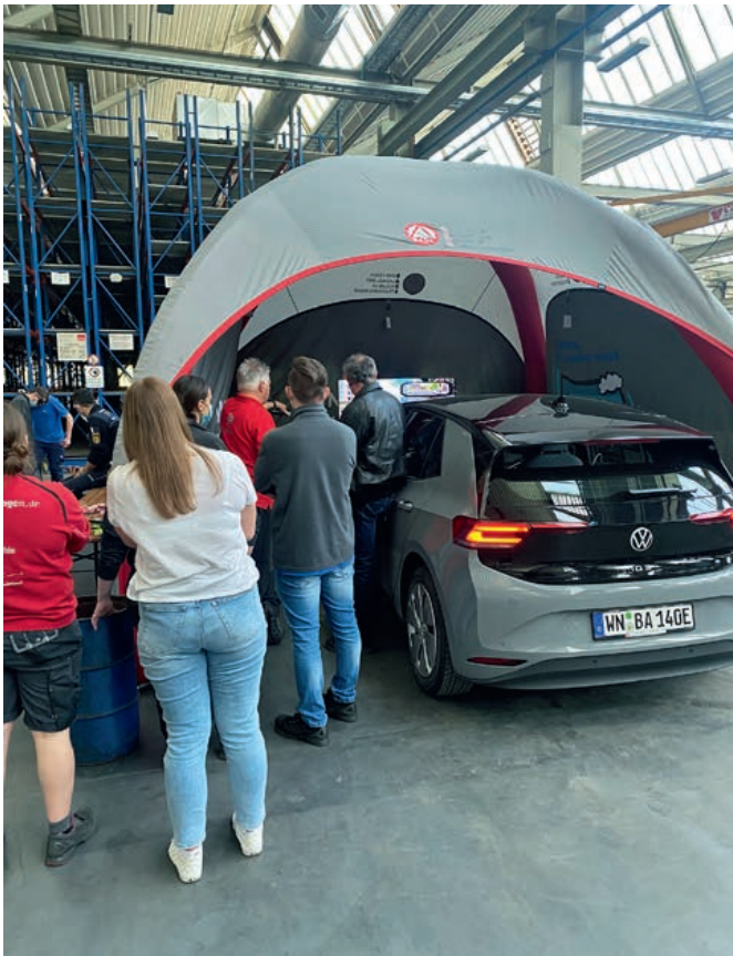
Der neue Fahrsimulator VW ID 3 und der neue Pavillon

Erweiterung zu den Rauschbrillen einen Blazepod-Parcours.