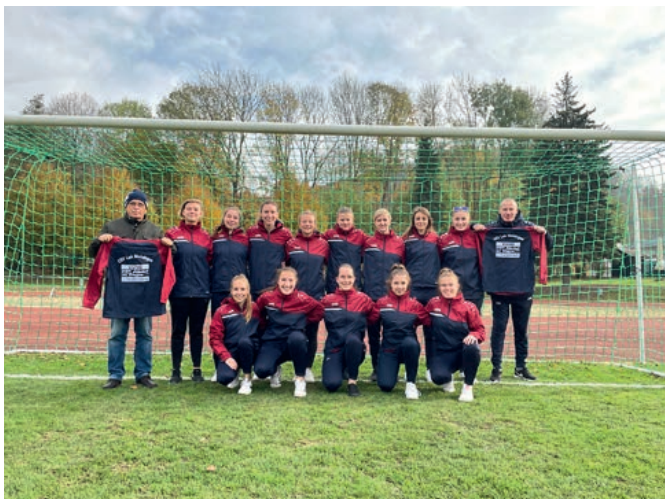
Übergabe einer Fußballausrüstung an die Mädchenmannschaft des ESV Lok Meiningen durch die Landesektion Thüringen