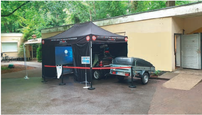
Der neue Anhänger für den Realo-Smart-Fahrsimulator

men im Fahrsimulator Platz. Durch die Corona-Pandemie war die Aufklärungsarbeit von Oktober 2021 bis April 2022 nicht möglich.