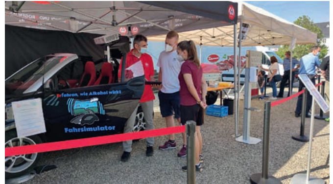
Einsatz unter Corona-Bedingungen am „Tag der Polizei“