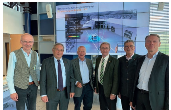
Tagungsräume mit Teilnehmern des Symposiums bei der Fahrzeugsystemdaten GmbH (FSD), Radeberg