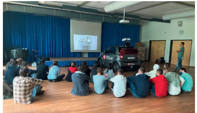
Einsatz des Fahrsimulators im Rahmen eines Verkehrssicherheitstages am Reichswaldgymnasium Ramstein

sicherheitsaktion „BOB – fährt Freunde“. Bei mehreren Veranstaltungen im Frühjahr und Sommer 2022, überwiegend Verkehrssicherheitstage an Schulen und Universitäten, unterstützte die Landesektion die Verantwortlichen der örtlichen BOB-Initiativen in Rheinland-Pfalz durch Vorträge, den Einsatz des Fahrsimulators, der T-Wall und des Agility-Boards.