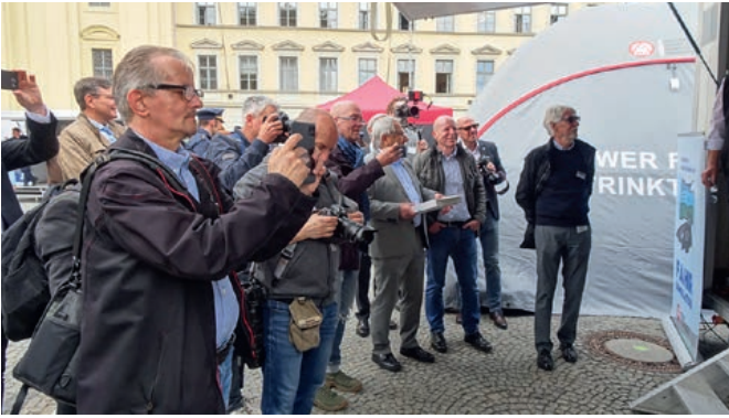
Medieninteresse vor dem Stand des BADS