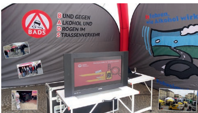
Der BADS beim Aktionstag auf dem Odeonsplatz in München