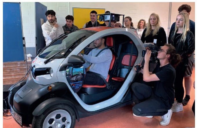
Der BADS zu Gast an der Bremer Europaschule

Am 23. Juni 2022 war es endlich wieder so weit: Die Landessektion Bremen hat nach langer coronabedingter Unterbrechung eine Kurztagung für Referendare mit anschließendem Trinktest durchgeführt. Fünfundzwanzig angehende Juristen konnten ihre ganz persönliche Erfahrung einer Fahrt unter „kontrollierter Alkoholisierung“ mit