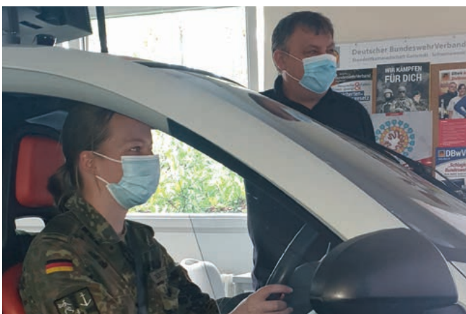
Der BADS bei der Bundeswehr in Garlstedt

Am 9. Juli 2022 stellte sich die Landesektion nach 2019 erneut beim Tag der offenen Tür an der Logistikschule der Bundeswehr im Kreis Osterholz-Scharmbeck dar, der durchaus als „Publikumsmagnet“ bezeichnet werden kann. Neben vielen jungen Soldaten nutzten zahlreiche Besucher die Gelegenheit zu einer „Fahrt“ im Simulator. Des Weiteren wurde fortlaufend vor Kleingruppen der prämierte BADS-Film „Rausch“ mit jeweilig anschließender Erörterung präsentiert. Fazit: Ein gelungener Tag ganz im Sinne der Ziele des BADS!