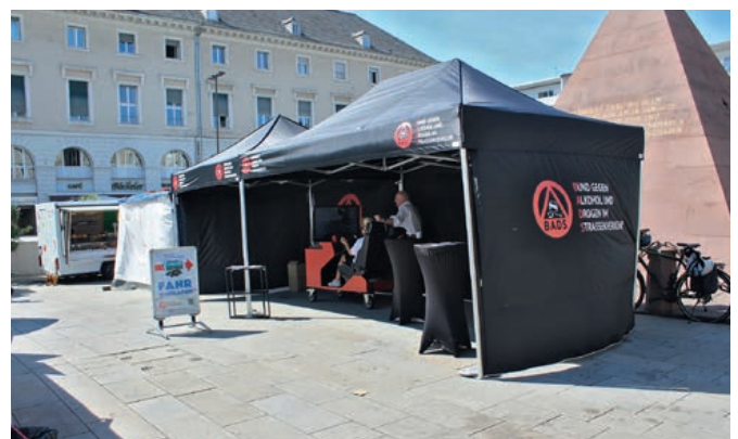
Die neuen Präsentationszelte der Landessektion auf dem Marktplatz in Karlsruhe

Danken möchte die Landessektion ausdrücklich an dieser Stelle der Landessektion Bayern-Süd und dort Detlef Tourneur, der der Landessektion für den Herbst die kos-