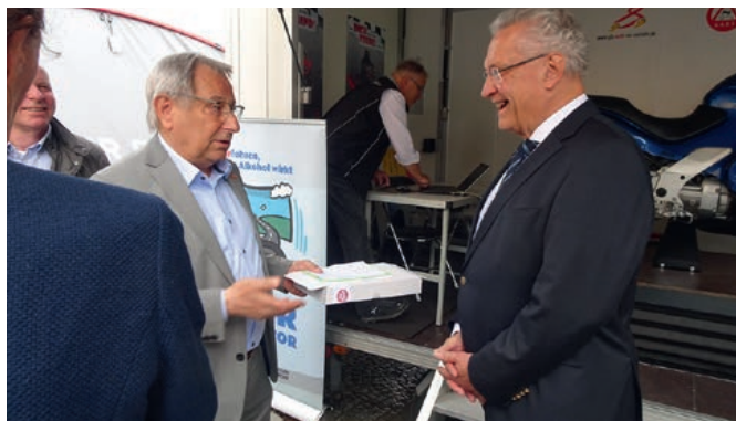
BADS-Präsident mit Innenminister Joachim Herrmann