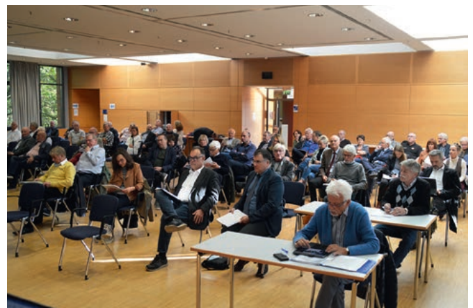
Plenum der Mitgliederversammlung