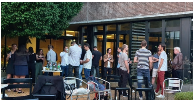
Angeregte Diskussionen bei der StA FR

Hinweis: Jeder achte Verkehrsunfall passierte 2021, weil ein Verkehrsteilnehmer abgelenkt war, meist durch die