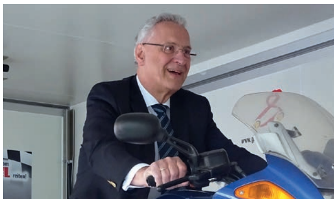
Innenminister Joachim Herrmann auf dem Motorradsimulator

In dem Spot will ein sichtlich betrunkenener Autofahrer gerade zu einer Fahrt starten. Die Situation wird aber von einem Hund erschnüffelt, der sich den Fahrzeugschlüssel holt. „Der Hund als viel beschworener Freund des Menschen bewahrt also sein „Herrchen“ auch vor einer alkoholisierten Teilnahme am Straßenverkehr“, sagte Helmut Trentmann und verwies insbesondere auf den Schluss-Claim des Spots „Freunde lassen Freunde nicht betrunken fahren“.