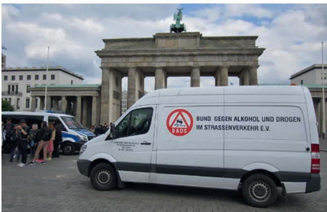
Der Fahrsimulator im Einsatz vor dem Brandenburger Tor