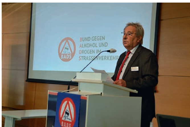
Der Präsident des BADS, Helmut Trentmann, bei der Vorstellung des Rechenschaftsberichts

Schon im Februar 2020 deutete sich an, welche Einschränkungen durch die Pandemie in allen Bereichen unserer Vereinsarbeit auf uns zukommen würden. Selbsterfahrungsversuche, Symposien und Vortragsveranstaltungen waren sozusagen von jetzt auf gleich nicht mehr möglich. Umso mehr gilt es auf die bemerkenswerten Bemühungen in den Landessektionen und Bundesgremien hinzuweisen, mit Ideen und Alternativen auch in dieser besonderen Zeit weiterhin präventiv zu arbeiten und insbesondere unsere Zielgruppen zu erreichen. Nach nunmehr mehr als eineinhalb Jahren Pandemie hat die Präventionsarbeit aber dennoch gelitten und der vereinsübergreifende und vereinsinterne fachliche und organisatorische Austausch war erheblich erschwert. Mit Videokonferenzen konnte zwar manches ersetzt werden, der persönliche Kontakt ist und bleibt jedoch unverzichtbar.