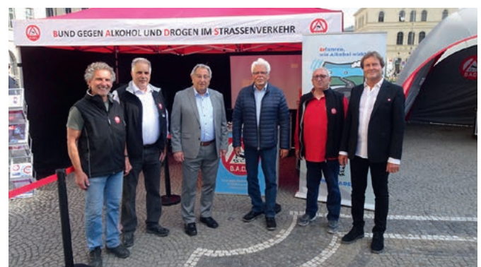
Das BADS-Team bei der Veranstaltung „sicher.mobil.leben“