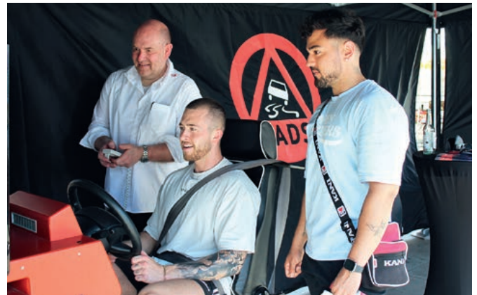
Großes Interesse und reger Betrieb am Fahrsimulator

ten Fahrzeuge nach Gebrauch ordnungswidrig im öffentlichen Verkehrsraum abstellen. Als repressive Maßnahmen zur Eindämmung dieser Verkehrsverstöße wurden seitens der Polizei verstärkt Verkehrskontrollen, insbesondere zu Nachtzeiten, ins Auge gefasst. Ebenso erschienen striktere Anweisungen an die Verleihfirmen zielführend.