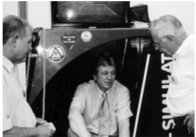
Hessens Innenminister Volker Bouffier anlässlich des Hessentages im Juni 2005 in Weilburg

Zum festen Programm gehört weiterhin die wissenschaftliche Referendarfortbildung im Rahmen der Arbeitsgemeinschaften innerhalb der Landgerichtsbezirke. Flankierend wurden bei finanzieller Kostenbeteiligung auch Selbsterfahrungstests unter Verwendung von AAK-Messgeräten angeboten. Unter Einbeziehung gelegentlicher Selbsterfahrungstests mit interessierten Richtern, Staats-