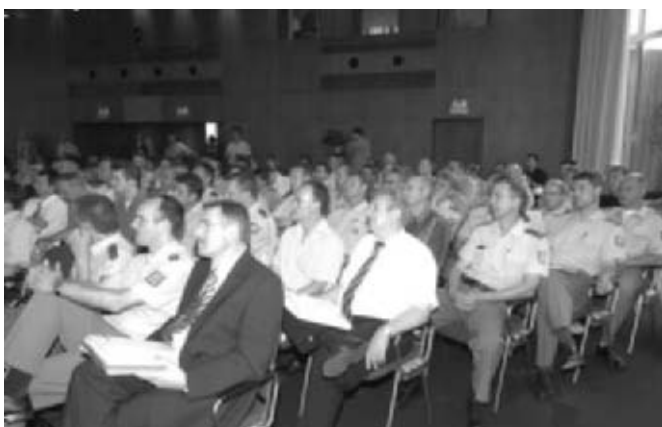
Die Referenten finden ein aufmerksames Auditorium beim Europäischen Expertentreffen

Herausragendes Ereignis im vielfältigen Tätigkeitsspektrum der Landesektion war jedoch das am 28.06.2005 in Saarbrücken gemeinsam mit dem Ministerium für Inneres, Familie, Frauen und Sport, der Landespolizeidirektion des Saarlandes und dem Institut für Rechtsmedizin der Universität des Saarlandes organisierte Europäische Expertentreffen „Best practise der Drogenerkennung im Straßenverkehr“. Zwölf Experten aus acht europäischen Ländern (Belgien, Deutschland, Frankreich, Luxemburg, Niederlande, Österreich, Schweiz und Slowenien) aus den Disziplinen Polizei und Wissenschaft praktizierten den multinationalen Austausch polizeilicher, justizieller und rechtsmedizinischer Erfahrungen zu bewährten Praktiken und Methoden (best practise) der Drogenerkennung im Straßenverkehr. Mit über 200 fachkundigen Zuhörern, u. a. aus Frankreich und Luxemburg, fand das Expertentreffen die erhoffte Resonanz. Nach einhelliger Auffassung des Fachpublikums sollte diese Fachtagung zukünftig regelmäßig stattfinden.