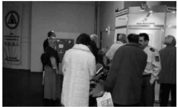
Der B.A.D.S. im Einsatz auf der CMT 2005

Gern ist die Landesektion Württemberg im abgelaufenen Geschäftsjahr dem gestellten Aufgabenkreis nachgekommen. Die jetzt wiederum veröffentlichten Zahlen hinsichtlich der Unfalllage in der Bundesrepublik Deutschland lassen nicht den Schluss zu, dass es wesentliche und grundlegende Änderungen auf dem Gebiet der Teilnahme am Straßenverkehr unter Alkohol und Drogen gegeben hat. Die polizeilichen Statistiken aus den einzelnen Bundesländern verheißten dazu nichts Gutes. Insofern hat sich die Arbeit wieder im kommenden Jahr auf diese Schwerpunkte zu konzentrieren. Die Landesektion Württemberg hat es sich unter ihrem Vorsitzenden Franz Hakala, Oberamtsrat a. D., und den Mitarbeitern, seinem Stellvertreter, Herbert Selting, Oberstaatsanwalt a. D., Gerichtsmediziner und Privatdozent Dr. Rainer Nowak, Ulm, Fritz Lohr, PHK a. D., Esslingen, und Volker Hossmann, EPHK, zur Aufgabe gemacht, die Aufklärungsarbeit noch