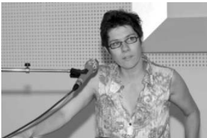
Innenministerin Annegret Kramp-Karrenbauer bei der Begrüßungsansprache im Rahmen des Europäischen Expertentreffens „Best practise der Drogenerkennung im Straßenverkehr“