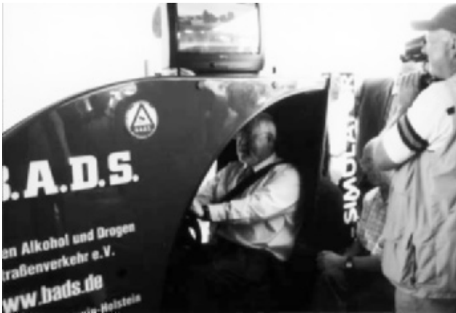
Ministerpräsident Peter-Harry Carstensen im Fahrsimulator

Die Moderatoren der Landesektion nahmen im Berichtszeitraum auch wieder viele Termine mit dem Fahrsimulator für andere Landesektionen wahr, u. a. in Düren, Mülheim, Neuss, Düsseldorf und Hamburg, zuletzt bei einer großen Veranstaltung für Richter und Staatsanwälte in Schwelm. Wegen der Einzelheiten kann auf die Berichte der Landesektionen verwiesen werden. Diese umfangreiche „Reisetätigkeit“ hat auch dazu geführt, dass wir ein neues Transportfahrzeug für den Simulator anschaffen mussten, dessen Finanzierung eine Umlage der anderen Landesektionen des B.A.D.S. ermöglicht hat. Wir danken hierfür ausdrücklich.