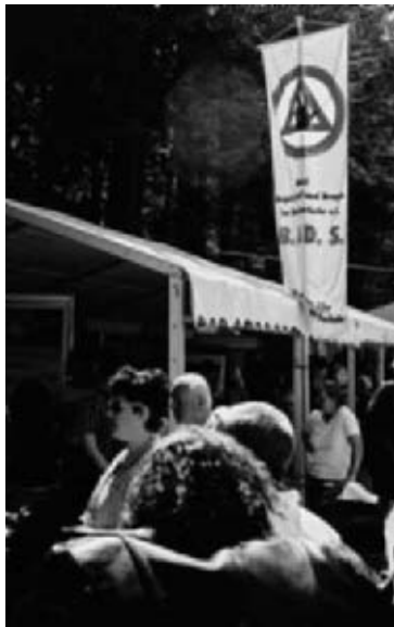
Motorradtreffen am 1. Mai 2005 am Ebnisee

Als weiteres Highlight kann die Veranstaltung „Fifty-fifty-Taxi“ im Ostalbkreis gesehen werden. Hier geht es darum, dass möglichst viele junge Leute im Alter von 14 bis einschließlich 25 Jahren sicher mit dem Taxi freitag- und samstagsabends sowie an den Abenden vor gesetzlichen Feiertagen von 22:00 Uhr bis 06:00 Uhr nach Veranstaltungen nach Hause gebracht werden. Für diese Aktion sind vom Ostalb-Kreis speziell entwickelte Poster in Umlauf gebracht worden.