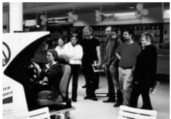
Einsatz des Fahrsimulators in der Abflughalle des Flughafens Bremen. Tendenz, die Frauen aktiv und die Männer schauen zu

Im Berichtszeitraum sind von der Landesektion drei Informationsveranstaltungen durchgeführt worden. Die einführenden Vorträge des Mediziners sowie des Staatsan-