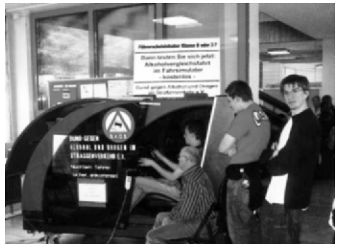
Einsatz des Fahrsimulators in einer Schule in Ingolstadt